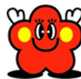
飛梅丸（とびうめまる）

福岡県では、障がいのある方のさらなる制作意欲の向上を促進し、県民に対して、障がいのある方が持っている多様な能力・才能に触れる機会を提供することを目的に、「2022 ふくおか県障がい児者美術展」を開催します。